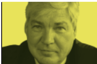
Michael Sommer, Vorsitzender des Deutschen Gewerkschaftsbunds