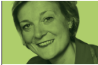
Monika Lüke, Generalsekretärin Amnesty International Deutschland

Die Absicht, 10.000 Roma in den Kosovo abzuschleppen, ist aus politischen und humanitären Gründen nicht hinnehmbar. Jeder weiß, dass die Lage dort nach wie vor politisch instabil und ökonomisch desolat ist. Es geht um Kinder und Jugendliche, die in ein Land abgeschoben werden sollen, das niemals ein Zuhause für sie gewesen ist. Es geht um Familien, die ihren Kindern hier in Deutschland durch eine qualifizierte Schul- und Berufsausbildung eine bessere Zukunft bieten möchten. Doch was möchte Deutschland ihnen nun bieten? Die Abschiebung in eine Zukunft voller Diskriminierung, Arbeitslosigkeit und Armut? Die Wahrung von Menschenrechten und Gleichberechtigung von Minderheiten sind zentrale Anliegen der Heinrich-Böll-Stiftung. Deshalb unterstützen wir die Kampagne, um die Öffentlichkeit gegen die Abschiebung der Roma aufzurütteln.