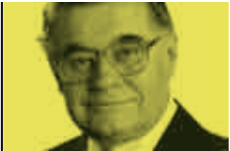
Hans Koschnick, SPD, ehemaliger EU-Administrator für Mostar und Bosnien-Beauftragter der Bundesregierung

Die Forderung nach einem Bleiberecht für Roma in Deutschland begründet sich für Aktion Sühnezeichen Friedensdienste in der historischen Verantwortung für den Völkermord an Roma und Sinti im Nationalsozialismus. Noch immer wissen wir viel zu wenig von dem Leid und der Vernichtung ganzer Roma-Familien und Dörfer während der deutschen Besatzungszeit – gerade im ehemaligen Jugoslawien. Bis heute hat nur ein Bruchteil der wenigen Überlebenden so genannte Wiedergutmachungsleistungen erhalten. Ein humanitäres Bleiberecht für langjährig geduldete Roma aus dem ehemaligen Jugoslawien in Deutschland ist daher aus historischen und humanitären Gründen geboten. Grundsätzlich sollte in Deutschland Flüchtlingen nach fünf Jahren Duldung das Daueraufenthaltsrecht zugesprochen werden, so wie es in zahlreichen anderen Staaten bereits geschieht.